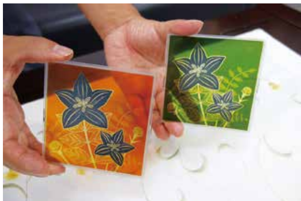
図3 手のひらサイズの蓄電機能内蔵太陽電池。シースルーなので窓にはめ込むこともできる

物が日陰や窓際でも光を集めて光合成をおこなうように、陽花灯は窓際で光を集め蓄電して、溜めた電気は夜間ランプやスマートホンの充電器用の電源として利用できる。現在、窓やテーブルなどへの応用も考えている。この太陽電池は、電気が溜まると花びらが青くなる。逆に、放電してしまうと花びらが白くなるのですぐわかる。そんな時には、窓辺に持って行って光を当ててやるとまた花びらが青くなって電気が溜まったことがわかる。まるで、鉢植えの植物を育てているようだ。これまでの太陽電池は黒い、重い、嵩張るといったイメージであったが、これなら楽しみながらエネルギーを作ることができる。「エネルギー」というと、何かと固いイメージが付きまとうものだが、このようなイメージを払拭して楽しみながらソフトにエネルギーを作り出すというコンセプトを提案したい。図3は、手のひらサイズの蓄電機能内蔵太陽電池である。デザインは自由自在だ。