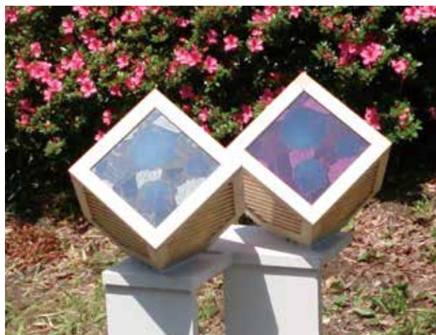
図2 アナベルを3枚組み合わせて作成した陽花灯。スマートホンの充電器として使えるように設計してある

この蓄電機能内蔵太陽電池では、太陽電池の原理的弱点であった光照射強度の急激な変化による急激な出力変動を抑制できるようになる。日照条件の急激な変化が起こっても、パソコン等の外部制御ではなく回路レスの内部制御で変動抑制することが可能である。また、この太陽電池は、弱い光量での発電特性に優れており、室内光や建物の窓や壁などに利用できる。このアナベルを3枚組み合わせて作製した「陽花灯（ひかり）」が図2である。これは室内の微弱光で発電と蓄電をおこない、必要に応じてUSBポートからの放電をおこなうコンセプトモデルである。自然界の植