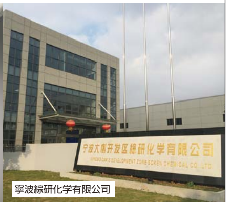
寧波綜研化学有限公司